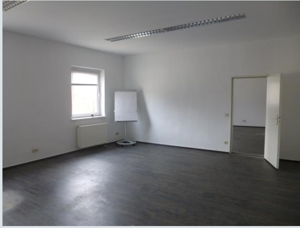
Große, helle Büroräume