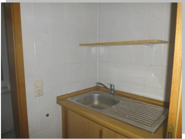
Blick in die Teeküche