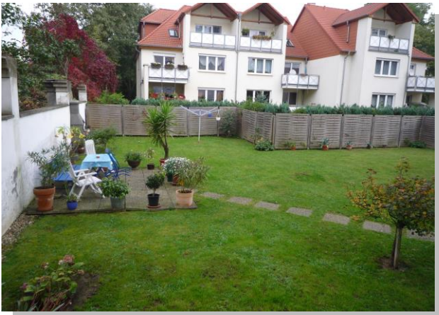
Garten, für alle Mieter nutzbar

Die Böden sind größtenteils mit Laminat, Fliesen oder Granit versehen, die Bäder teilweise mit Fußbodenheizung ausgestattet und die Edelholz oder Mahagoni-Türen runden das sehr schöne Wohnambiente ab. Zum Garten hin ausgerichtet, würde aufgrund der Vorkehrung der bodentiefen Fenster, noch die Möglichkeit bestehen, Balkone nachträglich anzubauen. Der angelegte Garten, bietet allen Mietern ausreichend Platz zur Erholung. Auch die Grillecke lädt im Sommer zu entspannten Abenden ein. Die Wohnimmobilie ist voll unterkellert und mit vier Viessmann-Gas-Brennwert bzw. zwei Buderus-Gas-Etagenthermen, mit integrierter Warmwasserversorgung ausgestattet.