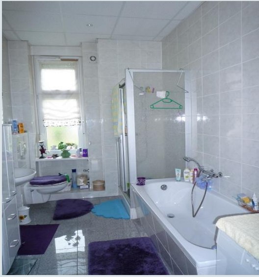
Badezimmer im Erdgeschoss