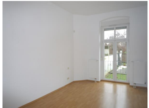
Schlafzimmer zum Garten