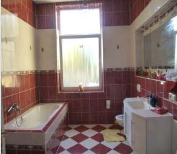
modernisiertes Badezimmer im 1. OG