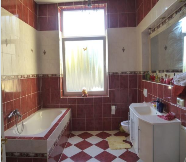
modernisiertes Badezimmer im 1. OG