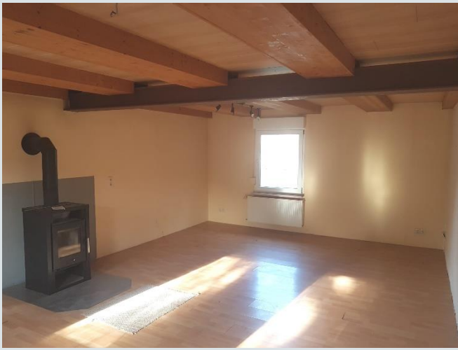
Blick in das Wohnzimmer