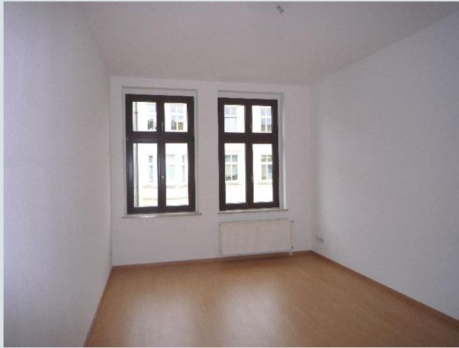
Blick in das Wohnzimmer