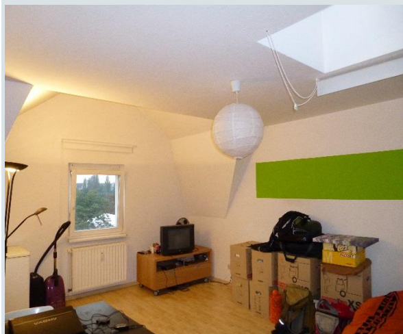
Blick in das Wohnzimmer