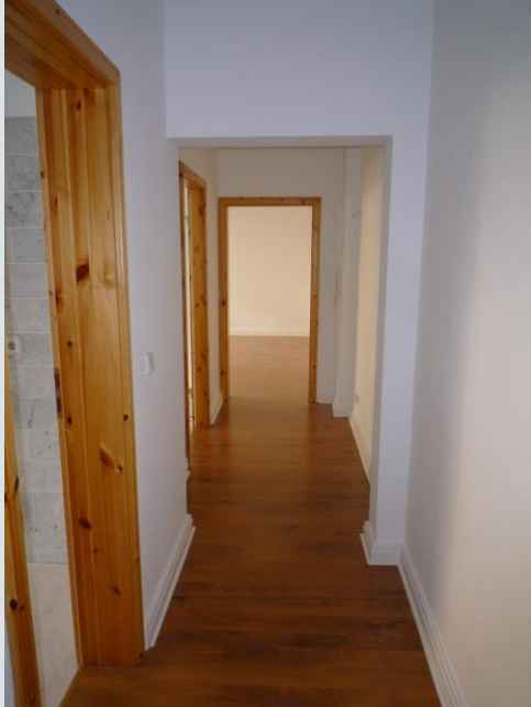
Blick in den Flur