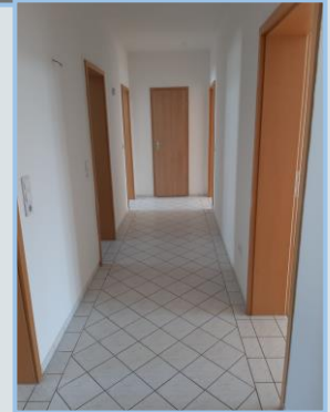
Von hier sind alle Zimmer begehbar.