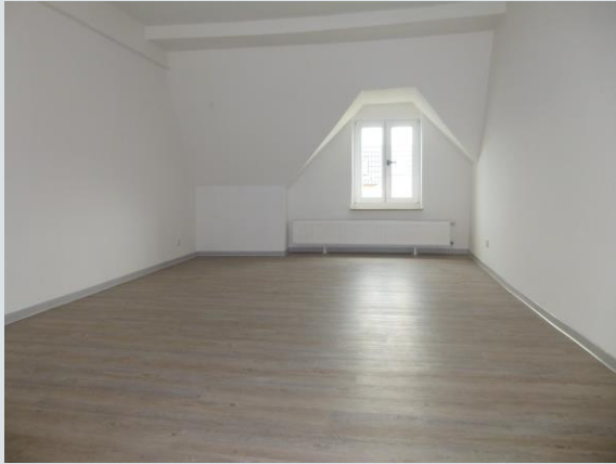
Individuell nutzbarer Wohnraum